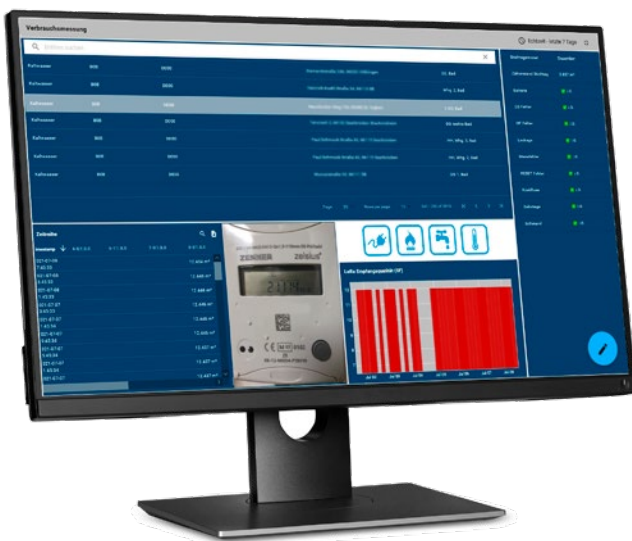
Verbrauchsmessungen im Überblick

Unser Paket beinhaltet neben den CO 2 -Sensoren und der LoRaWAN™-Infrastruktur auch den cloudbasierten Service zur Visualisierung der erhobenen Messwerte.