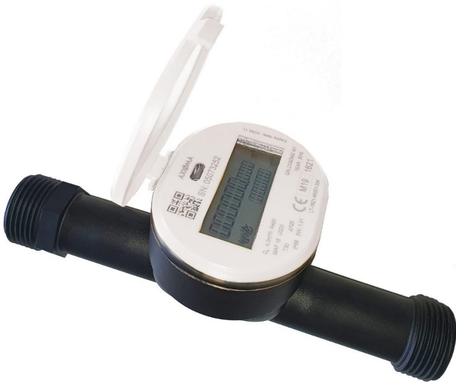
Bild1: Ultraschallwasserzähler Qalcosonic W1 mit wMBus und LoRaWAN zur gleichzeitigen Nutzung